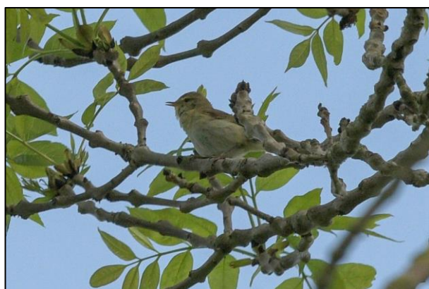
Iberische Tjiftjaf, Buttervlietpolder, mei 2018.